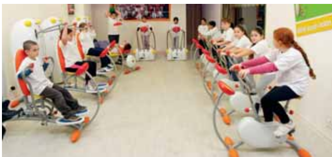
חדר כושר לילדים במרכז הפיס "קרית שרת"

ישנה כוונה להרחיב הפעילות בפינת החי הטיפולית ופתיחת פעילות סדנאית להורים וילדים, להקים בריכה הידרותרפית אשר תיתן מענה טיפולי מגוון לילדים ואנשים בעלי קשיי תפקוד, פתיחת קבוצות טיפוליות באמצעות בובנאות לילדים בעלי קשיים חברתיים ורגשיים ומתן פעילות טיפולית קבוצתית באמצעות אמנויות לחימה לילדים בעלי קשיים רגשיים חברתיים והתנהגותיים.