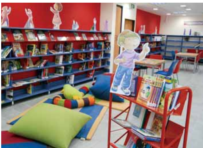
ספריית ביי"ס "נאות שושנים"