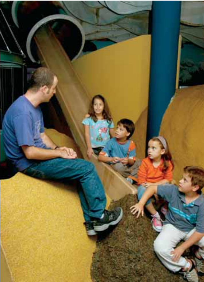
"היער הקסום" מוזיאון הילדים