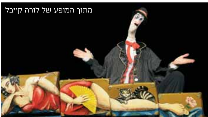
מתוך המופע של לורה קייבל