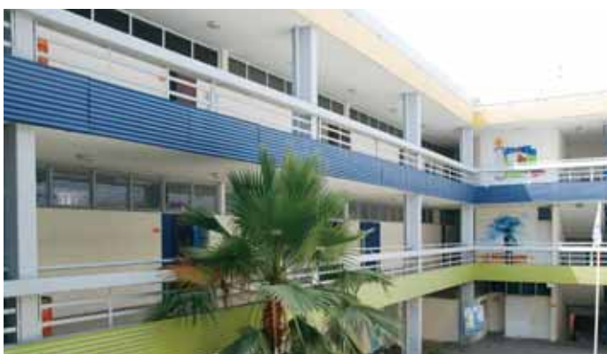
בי"ס "אורט חולון"