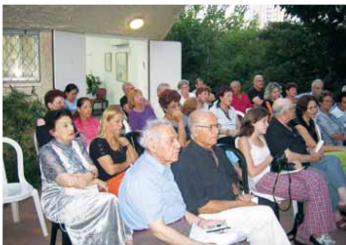
פעילות ב"בית המתנדב"

בחודש הקשיש הבינלאומי שצויין בנובמבר נבחר נושא הזהירות והבטיחות בדרכים בקרב הקשישים. הדגש שניתן בפעילויות המגוונות שכללו הרצאות, סדנאות, הצגות ועוד היה על ניראות (בחשיכה, בגשם וכו') ועל עליה וירידה מאוטובוסים. בנוסף, הוצגה בלובי העירייה תערוכה לרגל 60 שנה למדינה "ימין ושמאל כבשנו את החול".