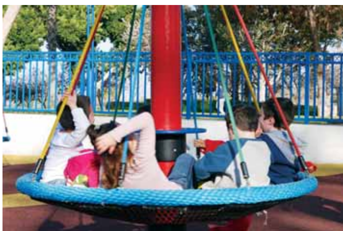
גן נגיש, פארק פרס

13 גנים ומגרשי משחק הממוקמים בחלקה המזרחי של קרית שרת שופצו וחודשו במהלך השנה החולפת. העבודות כללו שיקום התשתיות, חידוש הגינות והחלפת מתקני המשחק והריהוט. כמו כן, הוחלפו ארגזי החול במשטחי גומי כחלק מתהליך החלפתם בכל הגינות הציבוריות בעיר.