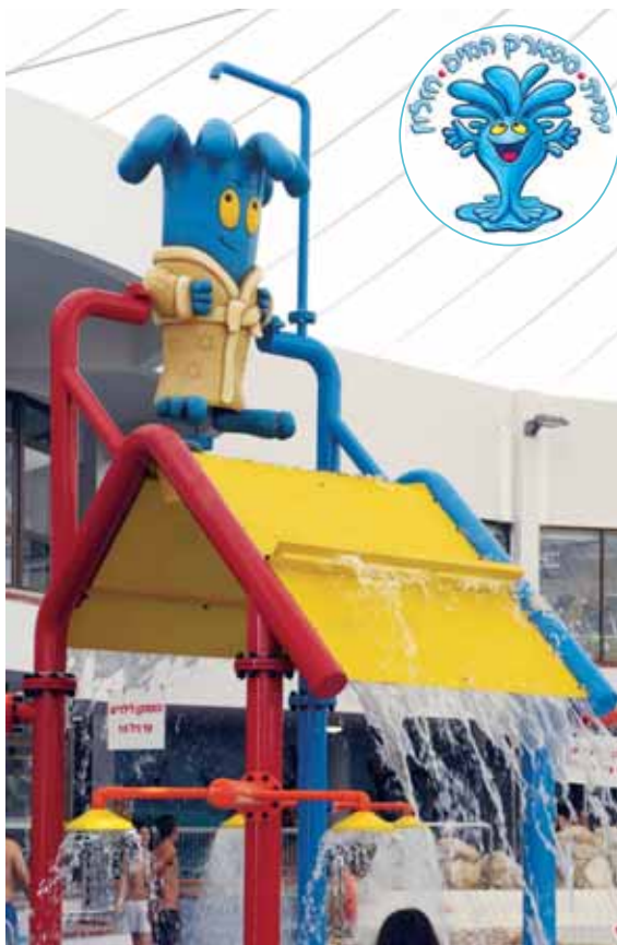
ספארק המים ימית

החל מהשנה מתקיימים בהיכל הספורט "קציר", המתמקד בגיל הרך, בתנועה וההתפתחות של הילד, חוגי תנועה לגיל הרך, חוגי אקרובטיקה וגאז' לגיל הרך ועד הגיל הבוגר ותנועה לתינוקות. השנה נפתח חוג כדוריד חדש לכיתות ב' ו', קורס הכנה ללידה לזוגות צעירים וחוג אירובי ועיצוב חדש לנערות ונשים.