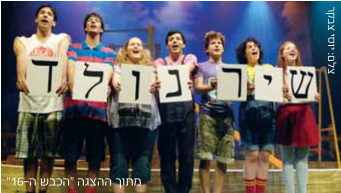
מתוך ההצגה "הכבש ה-16"