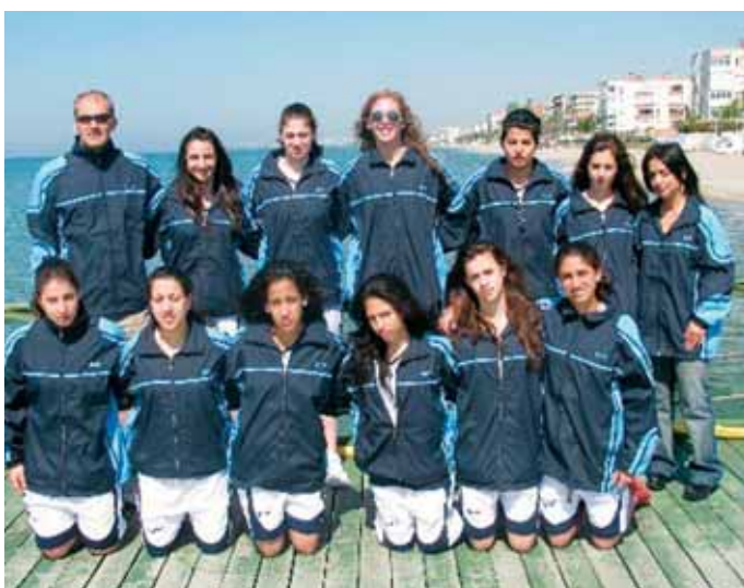
נבחרת הכדורסל של תיכון "קרית שרת"

השנה יצאה עיריית חולון בפיילוט ייחודי "הורד וסע" להעלאה ולהורדת תלמידים בבתי"ס "ביאליק" ו"התבור" בסיוע הורים מתנדבים. מטרת הפיילוט לצמצם את לחץ התנועה בכבישים הסמוכים לביה"ס במיוחד בשעות העומס ובכך לשמור על חיי התלמידים והוריהם.