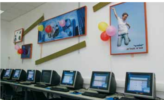
מעבדת מחשבים, ביי"ס "אורט חולון"

תכנית "מצויינות 2000" בחטיבות הביניים הורחבה השנה ומספר המשתתפים בה עמד על 250 תלמידים. התכנית מטפחת שוחרי מתמטיקה ומדעים בכיתות ז'-ח' כשהשלב הראשון הוא הכשרת מורי החטיבות ושידרוג המיומנות שלהם. באמצעות התכנית מקבלים התלמידים 4 שעות לימוד נוספות בשבוע.