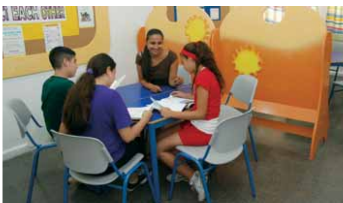
פינת למידה בבי"ס "יצחק בן צבי"

בשנה החולפת נוספו 7 גני ילדים חדשים או מחודשים. כמו כן, התרחבה תכנית האשכולות המרחביים והגיעה ל- 13 במספר כאשר אשכולות הגנים מתמקדים בנושאים נבחרים ובעבודה משותפת. לקראת שנת הלימודים הנוכחית נפתחו 7 גני ילדים נוספים, כאשר 6 מתוכם הם במבנים עירוניים קיימים ובנוסף - סגירת חלל בבי"ס "ניצנים" והתאמתו לחטיבה צעירה, לגילאי גן חובה. אחד הגנים שנפתחו מיועד לילדים לקויי למידה רב גילאי. כל הגנים כלולים בתכנית הרב שנתית העירונית כחלק מהמאמצים שעושה העירייה לתת מענה הולם לגידול המהיר במספר הילדים בחולון.