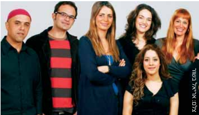
מתוך פסטיבל "ימי זמר"