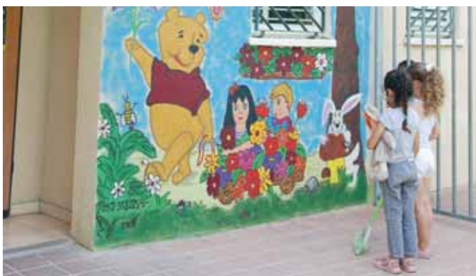
גן הרדוף, נאות בן גוריון