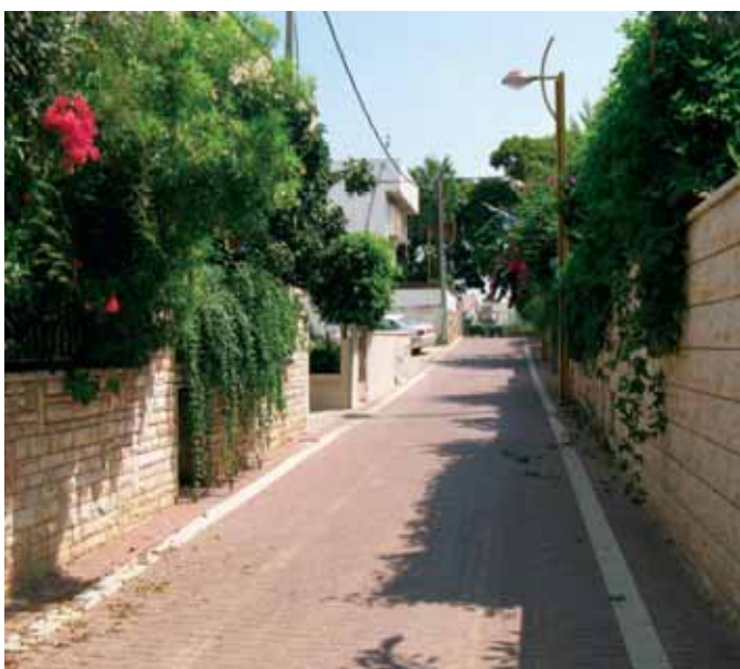
סמטה מרחוב הספורטאים

השנה החל פרויקט משותף של נתיבי איילון ומחלקת התנועה העירונית הבוחן אפשרות להפעלת אוטובוסים בתדירויות גבוהות הנותנים מענה מבחינת קיבולות ורמות שירות גבוהות במיוחד, כל זאת עד לאישור הרכבת הקלה על תוואי הדרך.