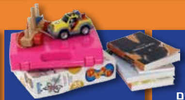
דברים שינעימו את הזמן ויקלו את השהייה כגון: משחקים, עיתונים, ספרים