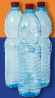
מים בבקבוקים סגורים יש להכין ארבעה ליטרים בעבור כל אדם ליממה