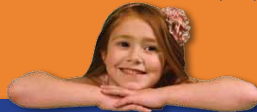
חשוב ליצור במרחב המוגן אווירה רגועה