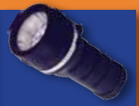
תאורת חירום או פנס וסוללות