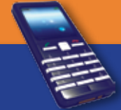
טלפון סלולרי מטען וסוללה נוספת