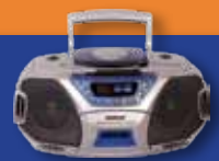
אמצעי תקשורת שיעזרו לנו להשאר מעודכנים (מחשב, טלויזיה, רדיו)

העתקי מסמכים חשובים מסמכים רפואיים, מסמכי זיהוי, מרשמי תרופות בשימוש קבוע, מסמכים אישיים ומסמכים פיננסיים (מומלץ להחזיקם גם במקום אחר מחוץ לבית לגיבוי)