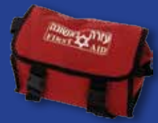
ערכת עזרה ראשונה