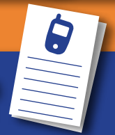
רשימת טלפונים של ארגוני החירום, של בני המשפחה והשכנים

יש לבצע פעולות אחזקה שוטפות לממ"ד ולמקלט לפי ההנחיות המפורסמות באתר האינטרנט של פיקוד העורף בכתובת: www.oref.org.il