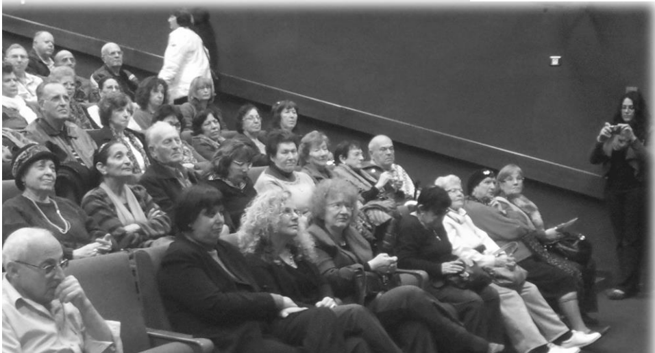
מפגש תושבים וותיקים בתהליך התכנון עם הנהגת העיר

עיריית חולון נרתמה למשימה של קידום תוכנית האב לאזרחים ותיקים על מנת לאפשר לתושבי העיר הוותיקים להמשיך ולהתגורר בעירם בבטחה וליהנות בה ממגוון אפשרויות תעסוקה ופנאי, כשהם מוקפים בבני משפחתם, בשכניהם ובקהילה תומכת. בכוונתנו לתמוך ולסייע לתושבינו הוותיקים להמשיך ליהנות מחייהם בעיר חולון על ידי פיתוח סביבה חברתית ופיסית נוחה להם וליצור עיר רב דורית, המוקירה את תרומתם וניסיונם של וותיקיה.