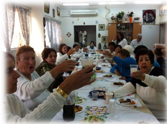
מועדון פינת חן מרכז קהילתי לזרוס